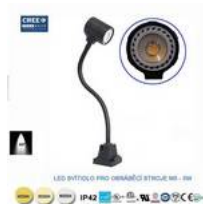
LED svítidlo pro obráběcí stroje M5-5W-24V-6000K