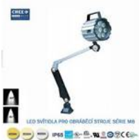
LED svítidlo pro obráběcí stroje M8-7W-6000K,24V