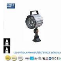
LED svítidlo pro obráběcí stroje M3-9W-6000K,24V