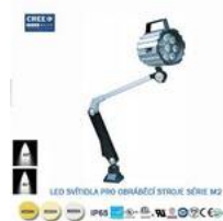
LED svítidlo pro obráběcí stroje M2-9W-6000K,220V