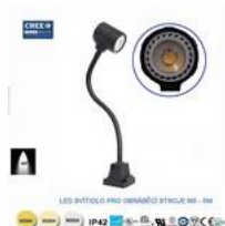
LED svítidlo pro obráběcí stroje M5-5W-220V-6000K