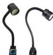
LED svítidlo pro obráběcí stroje M4-4.5W,60°,4000K, 24V DC magnet