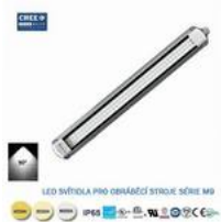
LED svítidlo pro obráběcí stroje M9-12W-445-5500K,24V

280/6W, 380/10W, 445/12W, 680/20W, 880/28W, 980/30W, 1250mm/40W