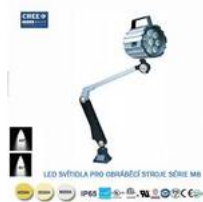
LED svítidlo pro obráběcí stroje M8-7W-6000K,220V