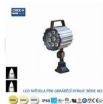
LED svítidlo pro obráběcí stroje M3-9W-6000K,220V