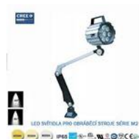
LED svítidlo pro obráběcí stroje M2-9W-6000K,24V